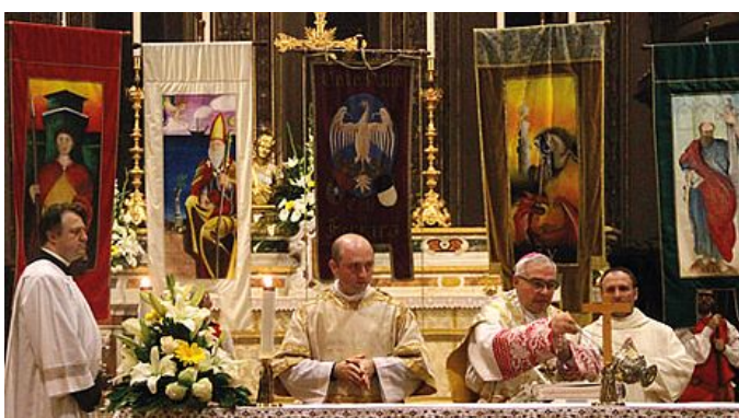
Il vescovo Negri presiede la cerimonia delle benedizioni dei Palii

«C'è un ottimo rapporto con l'arcivescovo Negri e con la diocesi e sono in programma delle collaborazioni».